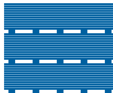
Figura 1: apilado de estibas

Hecho en México por Saint-Gobain Plaka, S.A. de C.V.