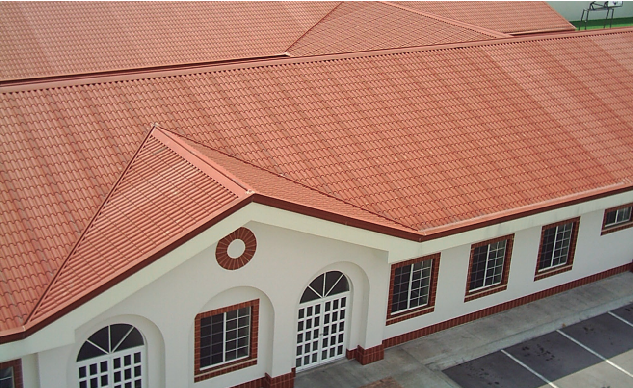
Cumple con las normas: ASTM E1646 & E 1680, ASTM C1363, ASTM E1592.